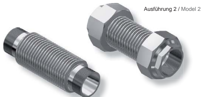
Ausführung 1 / Model 1

Type 246 is a single layer heating expansion joint with thread connections. It is available in 2 versions: